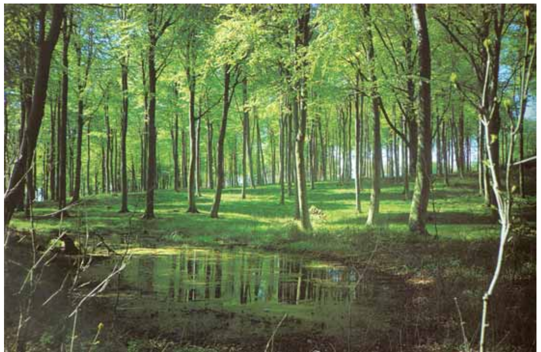
Den 120-140 år gamle, smukke bøgebevoksning risikerer snart fældning. Dens økonomiske værdi er tæt på at kulminere, hvorimod dens naturmæssige værdi stiger dag for dag. Ligeledes minimeres skovens æstetiske værdi hvis bevoksningen fældes eller udtyndes kraftigt for at skabe plads til selvforyngelse eller indplantning.

Henrik Staun: Skove og skovbrug på Langeland - fra istid til nutid. Langelands Museum 2005. 560 s.